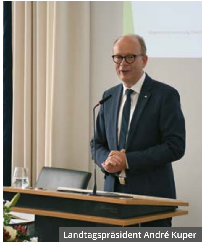
Landtagspräsident André Kuper