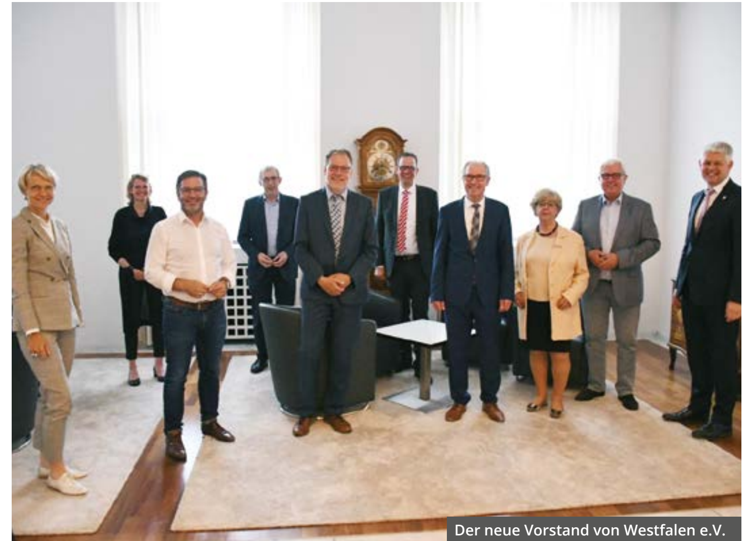
Der neue Vorstand von Westfalen e.V.

den neuen Beirat gesprochen, der im März/April 2022 erstmals tagen soll. Kooperationen mit der musik:landschaft westfalen, der Landwirtschaft und eine Orgelfestival waren weitere Themen. Der Vorstand setzt seine Klausurberatungen im März 2022 fort.